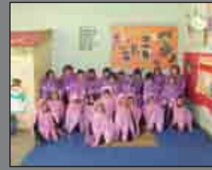
E. Infantil Pág. 10