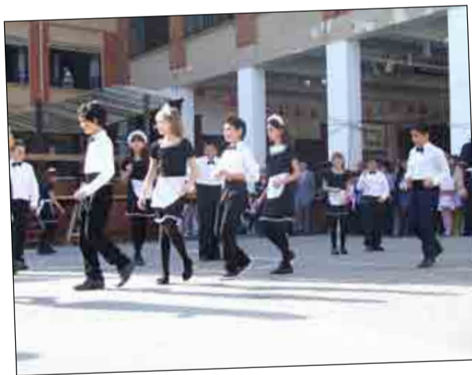
Los alumnos de 5º E.P. bailando "La camarera de mi amor"