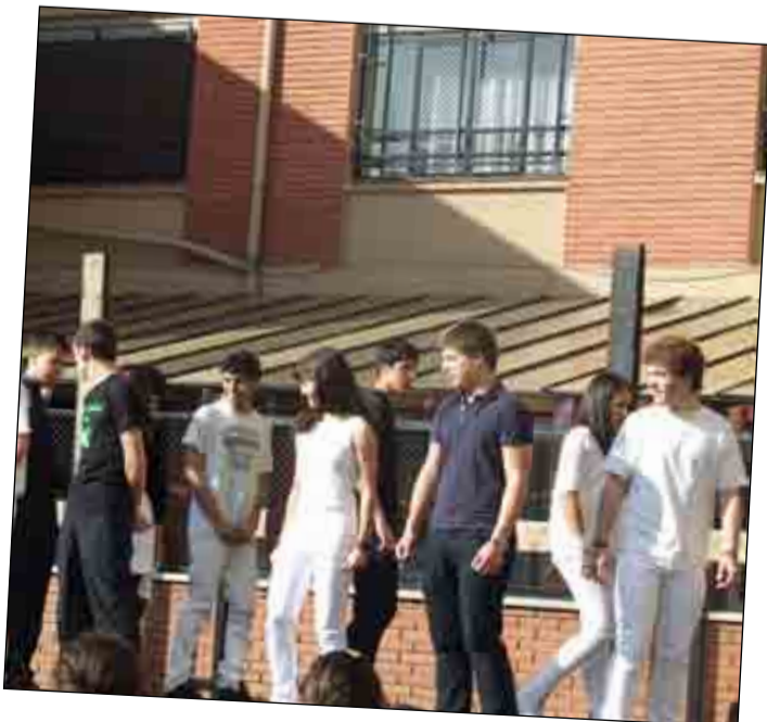
Los alumnos de 4º E.S.O. realizando la performance del pregón de las fiestas