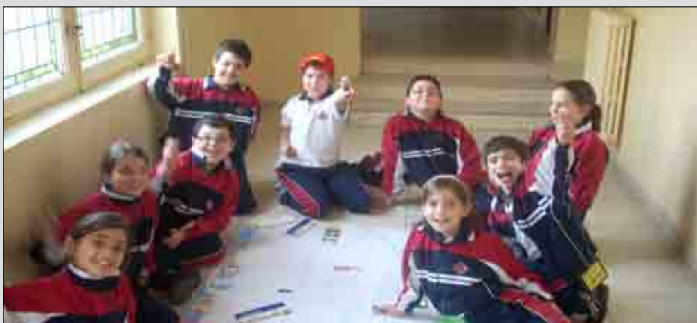
Convivencia de 3º y 4º de E. Primaria