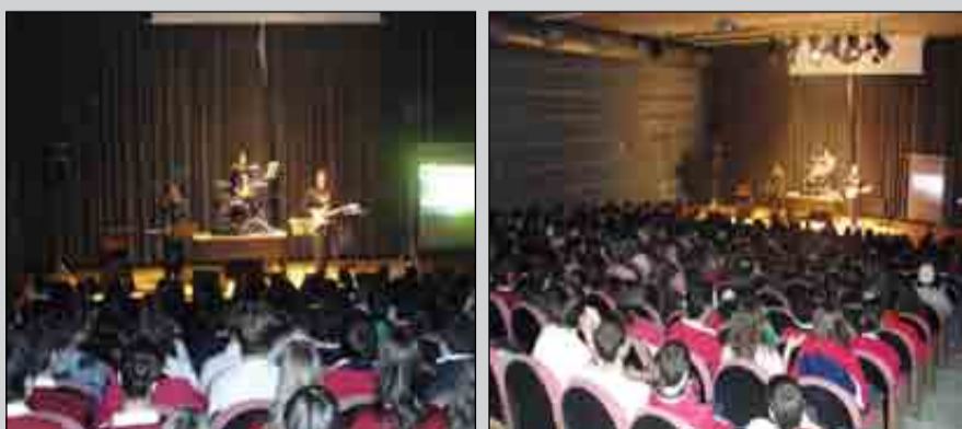
El grupo catalán "La armónica invisible" amenizó la mañana tocando piezas en directo de The Beatles, a la vez que fue desgranando las anécdotas más divertidas del cuarteto británico. Nuestros alumnos cantaron y bailaron sin parar durante más de una hora las piezas más emblemáticas de los "Fab Four".