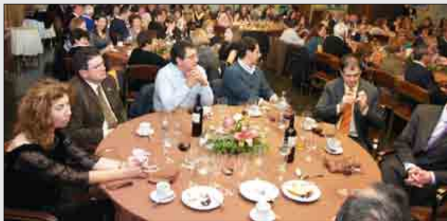
En las imágenes, varios momentos de la tradicional cena de convivencia que toda la comunidad educativa del Colegio Leonés celebra en San José.