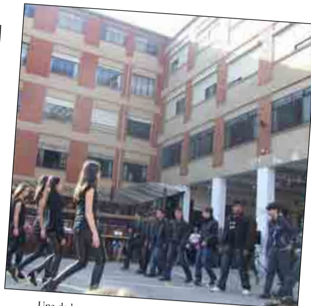
Una de las conocidas canciones de Grease fue el tema bailado por los alumnos de 3º E.S.O.