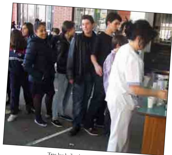
Tras los bailes, la tradicional chocolatada