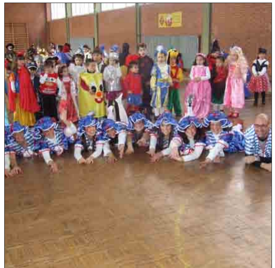
Los alumnos y alumnas de Educación Infantil y 1º de Primaria celebrando su tradicional fiesta de carnaval