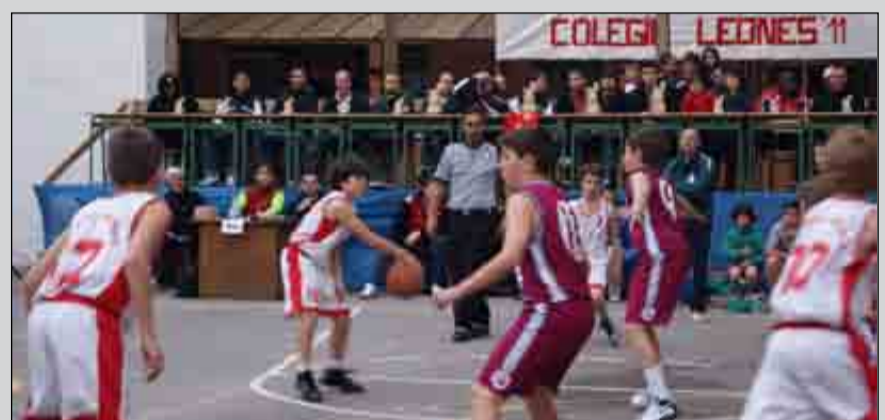
En las imágenes, varios momentos de la final del torneo y la posterior entrega del trofeo de ganadores a los chicos del Colegio Leonés de Corredera