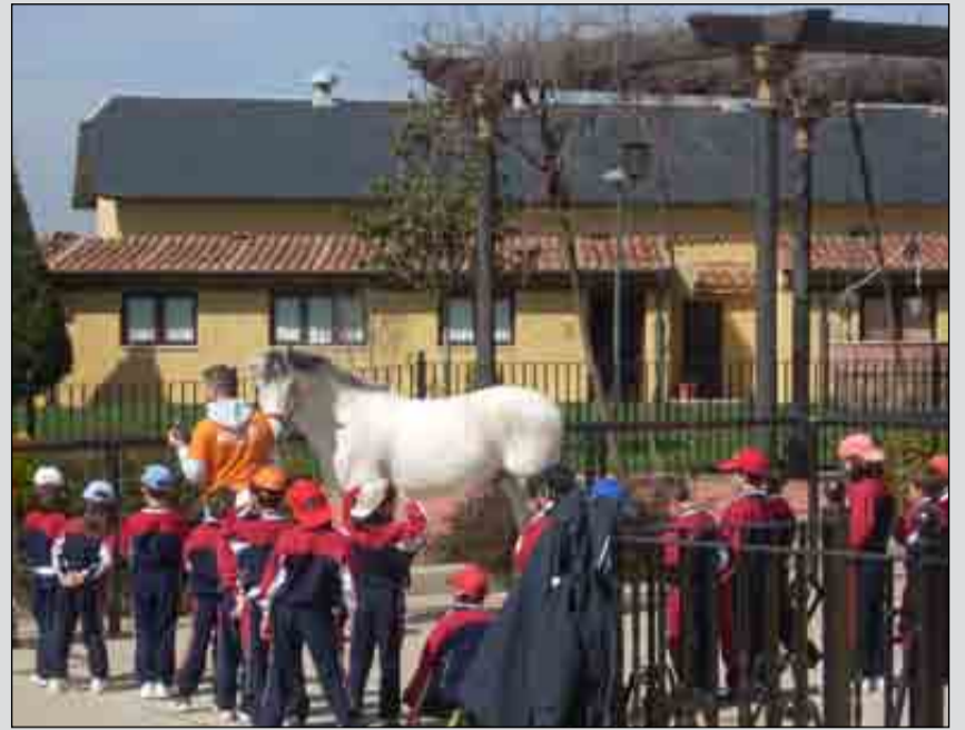
Los alumnos de 1º y 2º de E. Primaria disfrutaron de los caballos en Carriegos

Recientemente hemos tenido la presencia de un cuentacuentos para los alumnos de Infantil y el primer ciclo de Primaria, actividad muy apreciada por estos.