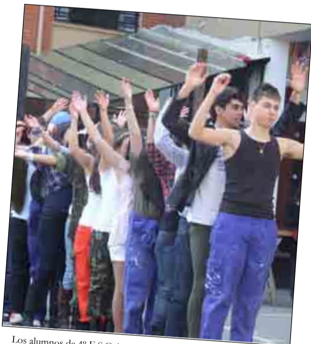
Los alumnos de 4º E.S.O. interpretando un tema de Village People