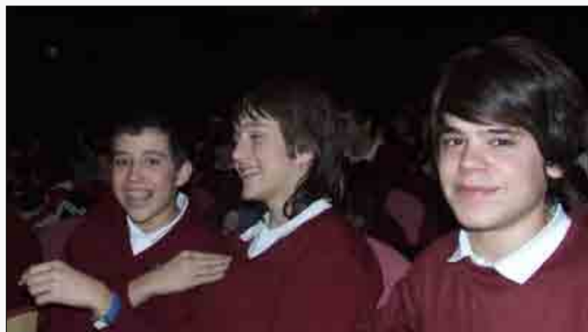
Nuestros alumnos se lo pasaron en grande con las funciones teatrales en inglés y francés

Esperamos continuar en años venideros con esta atractiva apuesta de fomentar el aprendizaje de un idioma a través del teatro.