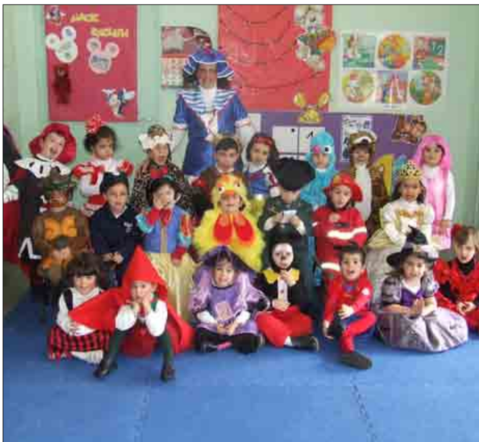
Los alumnos y alumnas de Educación Infantil vestidos con los disfraces caseros