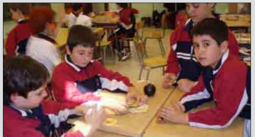
Los juegos de mesa no faltaron durante las fiestas del cole