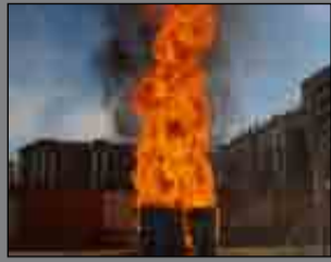
Fiestas del colegio Pág. 3