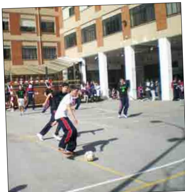
Los alumnos de 4º E.S.O. ganaron 3-1 la final de futbito frente a sus rivales de 3º E.S.O