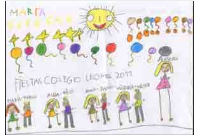
Los más peques dibujaron las fiestas del cole... a su manera...