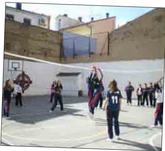
Las chicas de 2º E.S.O. jugando la final de Voleibol en el patio del colegio