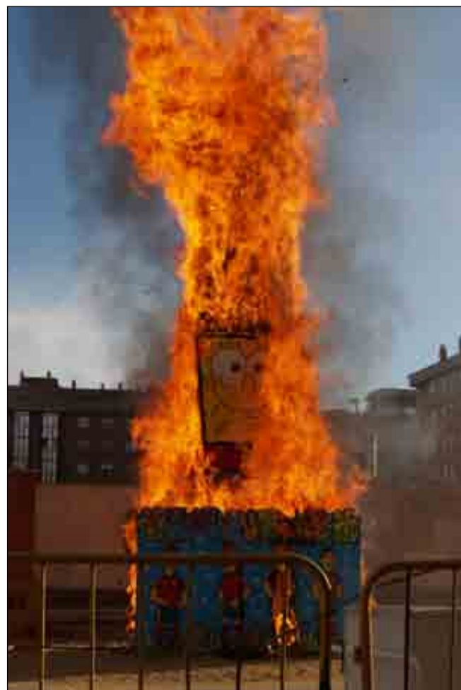
La quema de la falla (en cuya elaboración participaron los alumnos, pintándola) cerró los actos festivos de San José 2011.