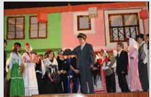
En las imágenes, varios momentos de los ensayos y la representación de “La Verbena de la Paloma”