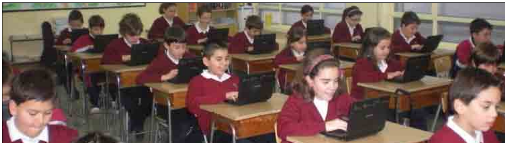
En la imagen, un momento de una de las clases de matemáticas de 5º de E. Primaria, en las que se ha integrado el programa "Red XXI".