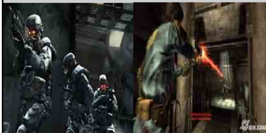
"Fallout 3" y "Killzone", dos de los juegos del año