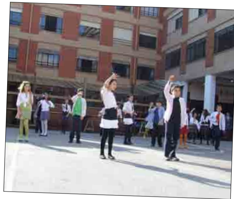
"Mambo nº 5" fue el tema bailado por los alumnos de 6º E.P.