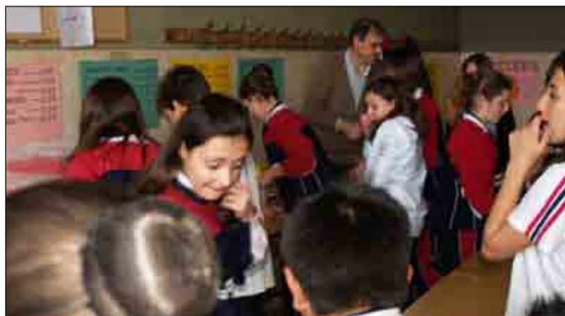
El kiosco, el puesto de pizzas y el bar fueron algunos de los puestos más visitados durante las fiestas.