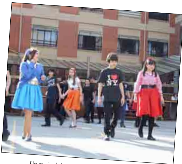
Un remix de los 60 fue el tema interpretado por los alumnos de 2º E.S.O