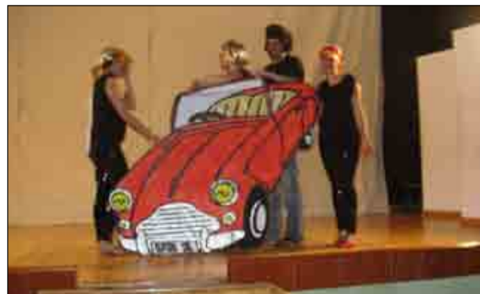
Los playbacks de los profes de E. Infantil hicieron las delicias de los más peques del cole