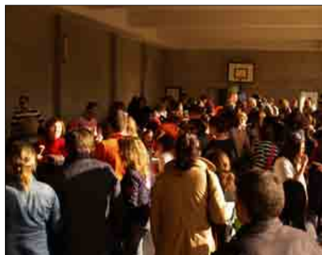
Los juegos de los más peques y el concurso gastronómico, un éxito de participación de alumnos y papás y mamás