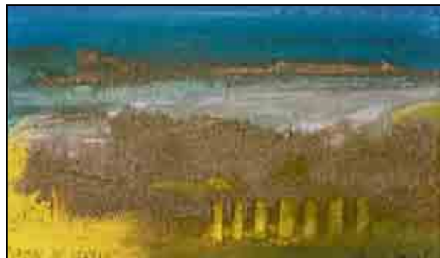
Algunos momentos del encuentro de los artistas con los alumnos y un detalle de una escultura de Uriarte y de un cuadro de Villa.