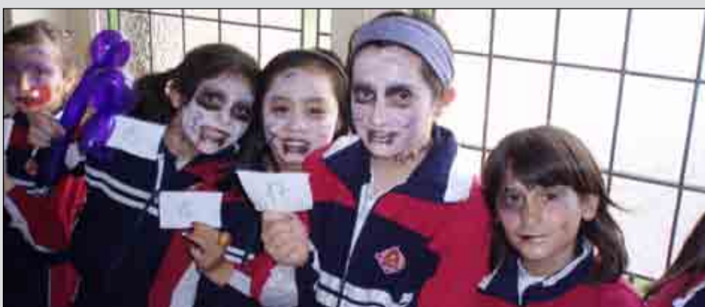
El concurso de maquillaje durante las fiestas fue muy divertido