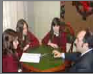
Nuevo uniforme Pág. 8