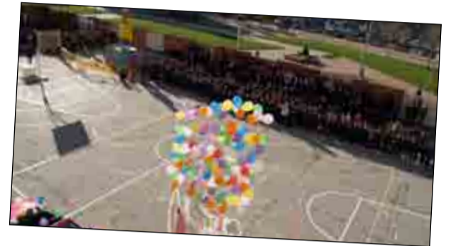
En las imágenes, varios momentos del inicio de las fiestas, con el pregón, la imposición de bandas a los reyes y reinas de las fiestas 2011 y la gran cabalgata