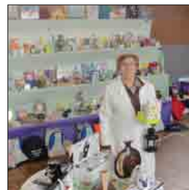
La tómbola solidaria con Urcos fue un total éxito, en buena parte gracias a la colaboración desinteresada de profesores y alumnos que ayudaron a preparar los artículos y a recoger el pabellón al finalizar las fiestas