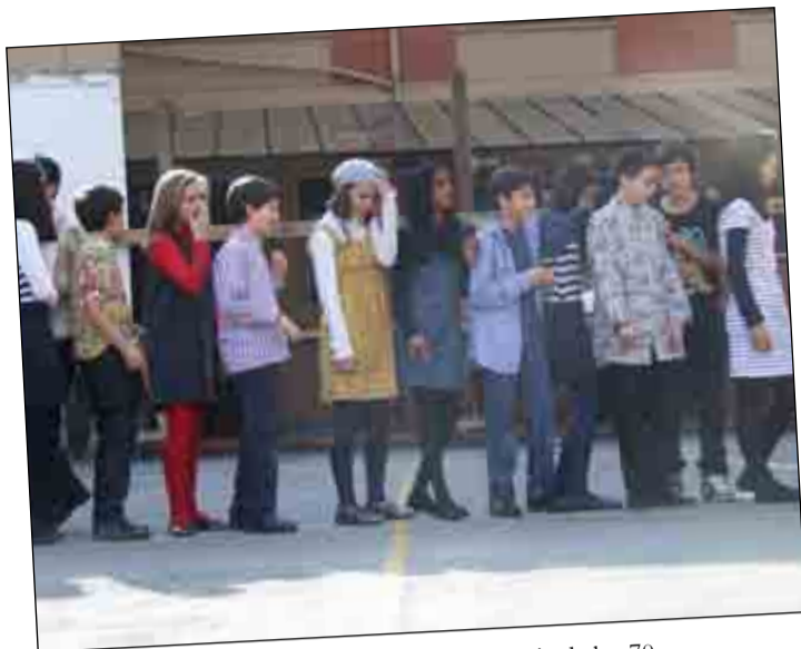
Los alumnos de 1º E.S.O. haciendo un remix de los 70